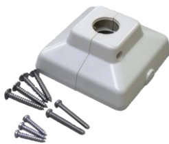
センサー取付台カバー