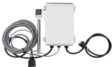
本体（制御用ボックス・センサー部）