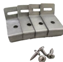
ポール（支柱）用取付金具