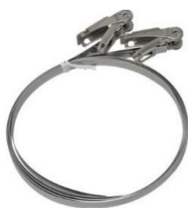
ポール（支柱）用取付金物