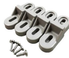
樹脂製外部取付足