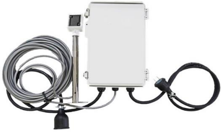
本体（制御用ボックス・センサー部）