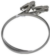
ポール（支柱）用取付金物