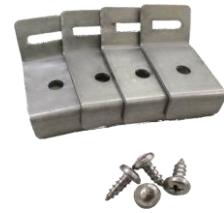
ポール（支柱）用取付金具