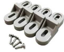
樹脂製外部取付足